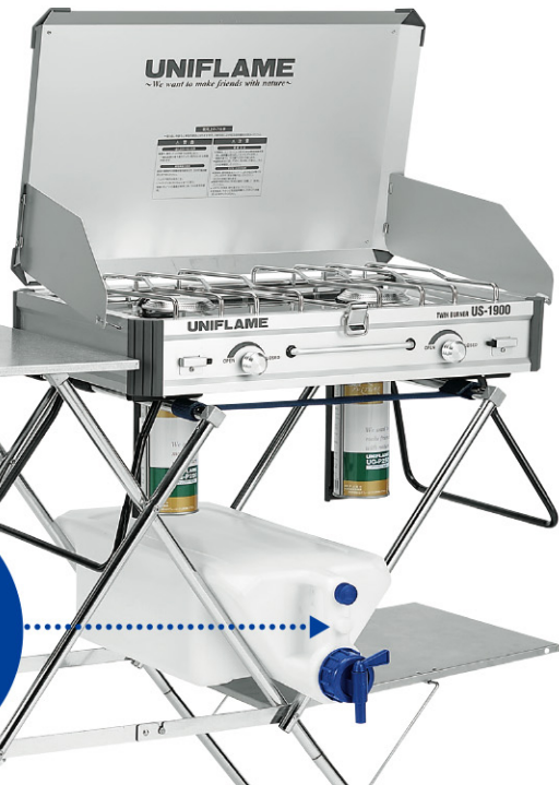
写真はキッチンスタンドⅢとツイーパーナーとの使用イメージです。