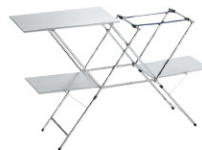
No.611784 キッチンスタンドⅡ (旧製品)