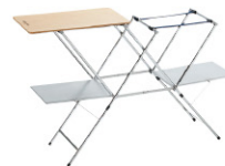
No.611791 キッチンスタンドⅡ WOOD (旧製品)

警告 取扱いを誤ると使用者が死亡・重傷を負う 状況が切迫して発生する場合があります。