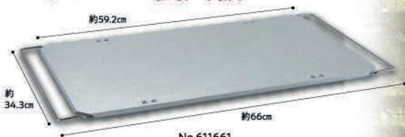
No.611661 フィールドラック ステンレス天板Ⅱ