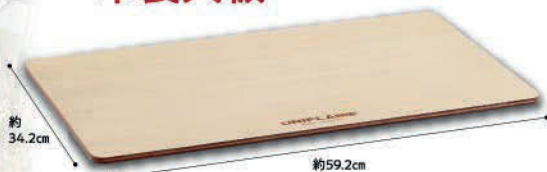
No.611654 フィールドラック WOOD天板