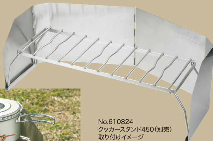
No.610824 クッカースタンド450(別売) 取り付けイメージ