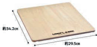
No.611586 フィールドラック WOOD天板ハーフ