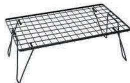
No.611616 フィールドラックブラック(別売) ※フィールドラック・クーラーBOXスタンド (旧タイプ・廃盤品)でもお使いいただけます。