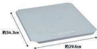
No.611593 フィールドラック ステンレス天板ハーフ

フィールドラックをローテーブルに! 2種類の天板を用途に応じて使い分け、それぞれの風合いを楽しむこともできます。 1台のフィールドラックに両方の天板ハーフを載せることも可能。