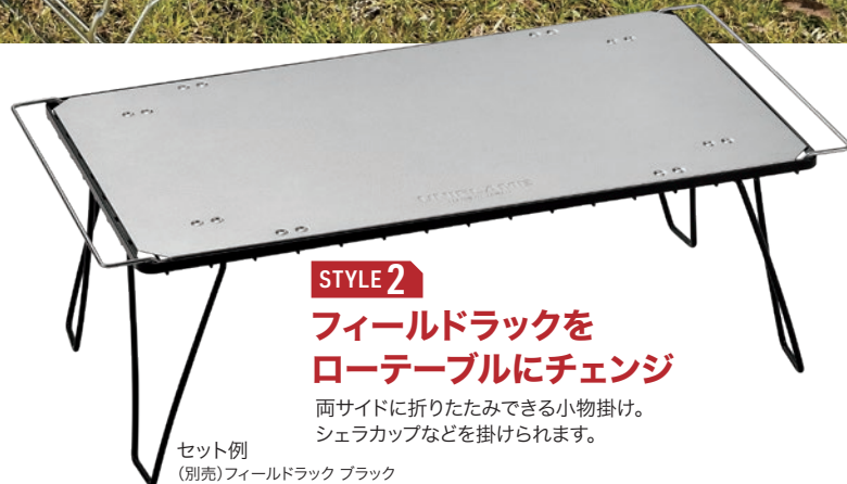
STYLE 2 フィールドラックを ローテーブルにチェンジ 両サイドに折りたたみできる小物掛け。 シェラカップなどを掛けられます。