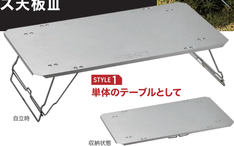
STYLE 1 単体のテーブルとして