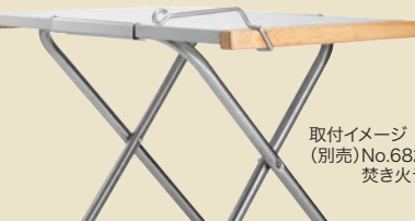
取付イメージ (別売)No.682104 焚き火テーブル