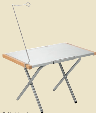
取付イメージ (別売)No.682104 焚き火テーブル