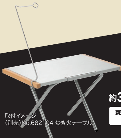
取付イメージ (別売)No.682104 焚き火テーブル